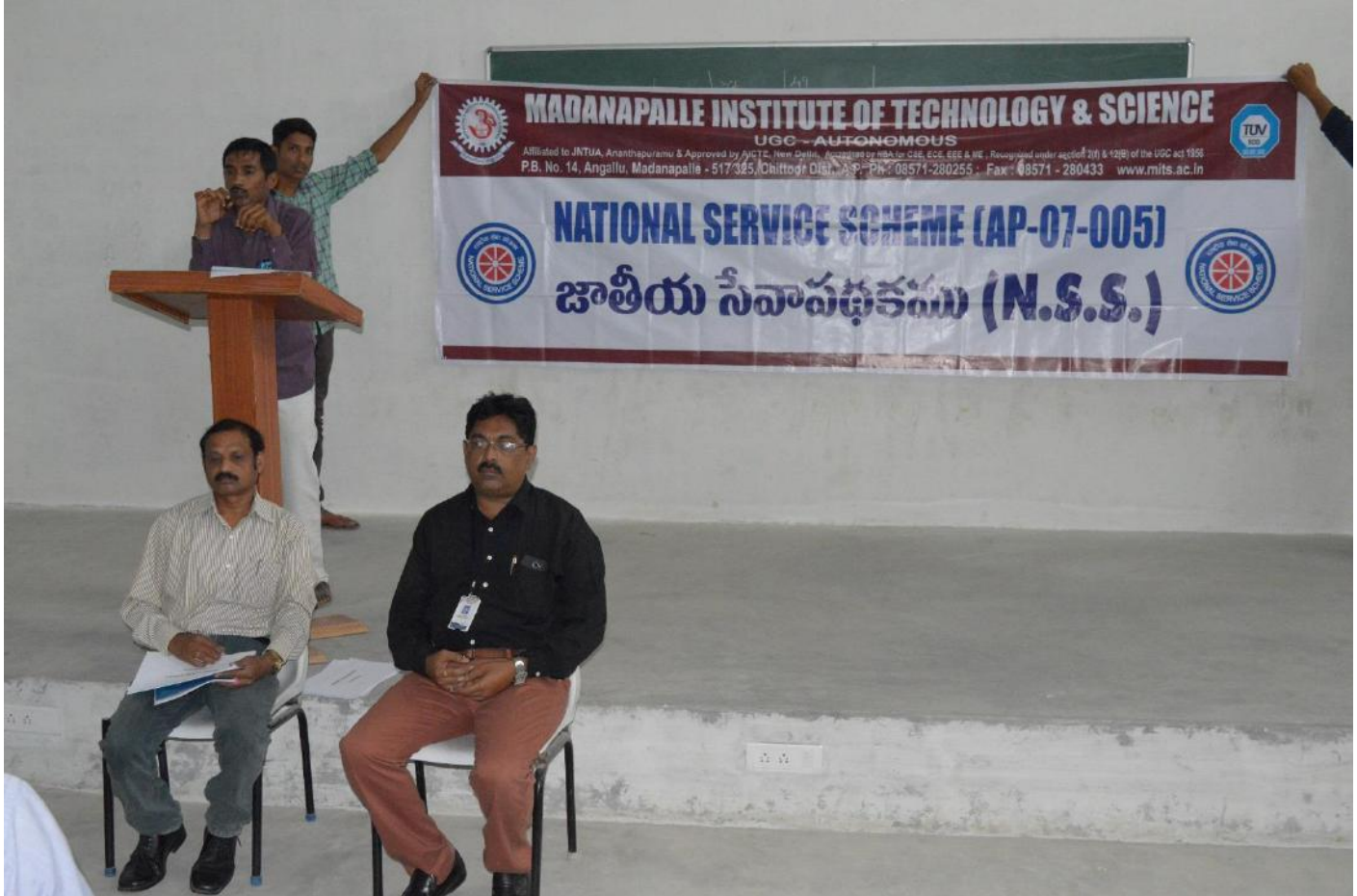
Resource person and our MITS faculty explaining the importance of the survey