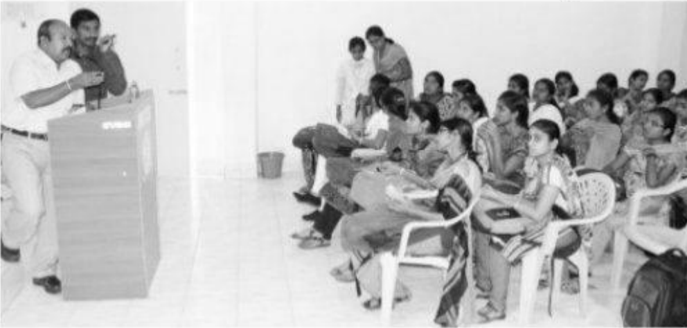
విద్యార్థులనుద్దేశించి మాట్లాడుతున్న మదనపల్లె మున్సిపల్ కమిషనర్